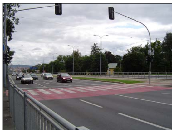
Nově dva levé odbočovací pruhy